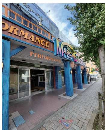
ショーは、同施設で働く10人余りのタレントを中心に日替りでものまね、パフォーマンス、歌、パフォーマンス、お笑い、ダンスなど

び、イタリアンやフレンチ、韓国などの多彩な料理とスイーツ、ドリンクを提供。150席の広さのフードコートで好みの料理に舌鼓を打ちながら、ステージで繰り広げられる圧巻のショーを楽しめる。