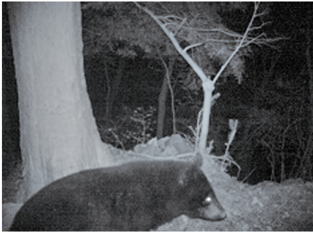
都環境局が設置したカメラに映るツキノワグマ